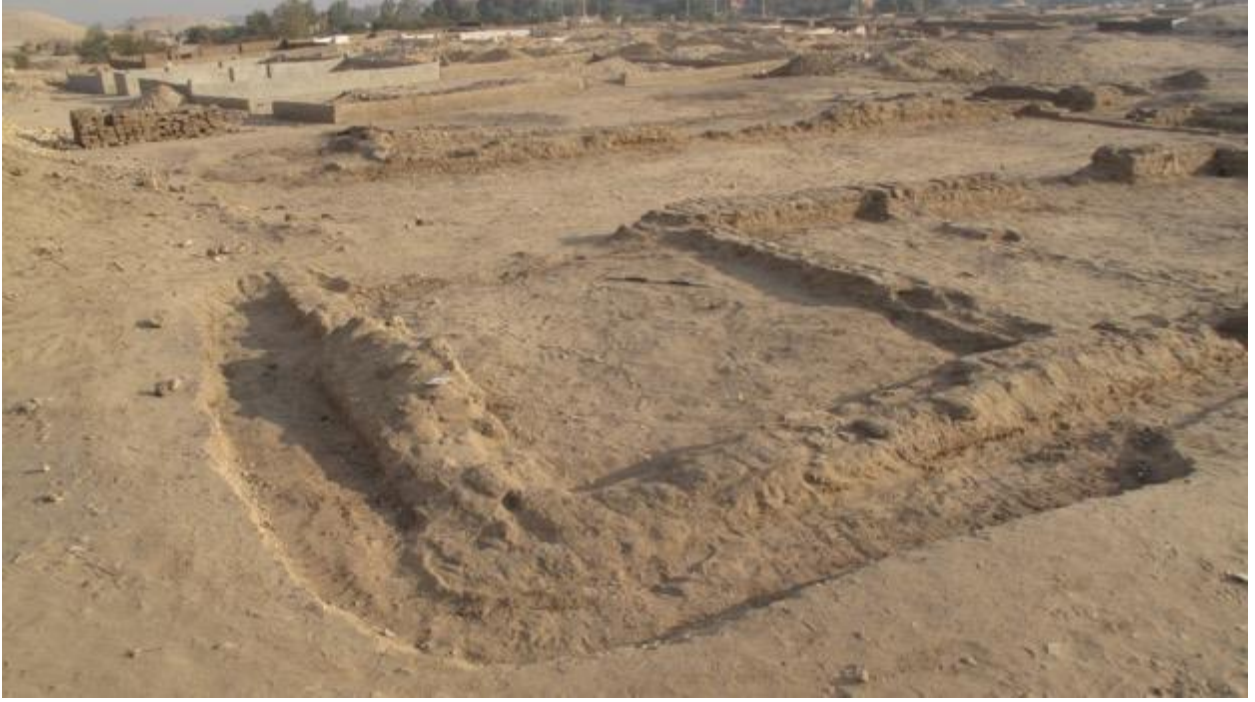
شكل ٧ . صورة توضح تعدي المقابر الحديثة على البيت A بجوار القصر الشمالي.