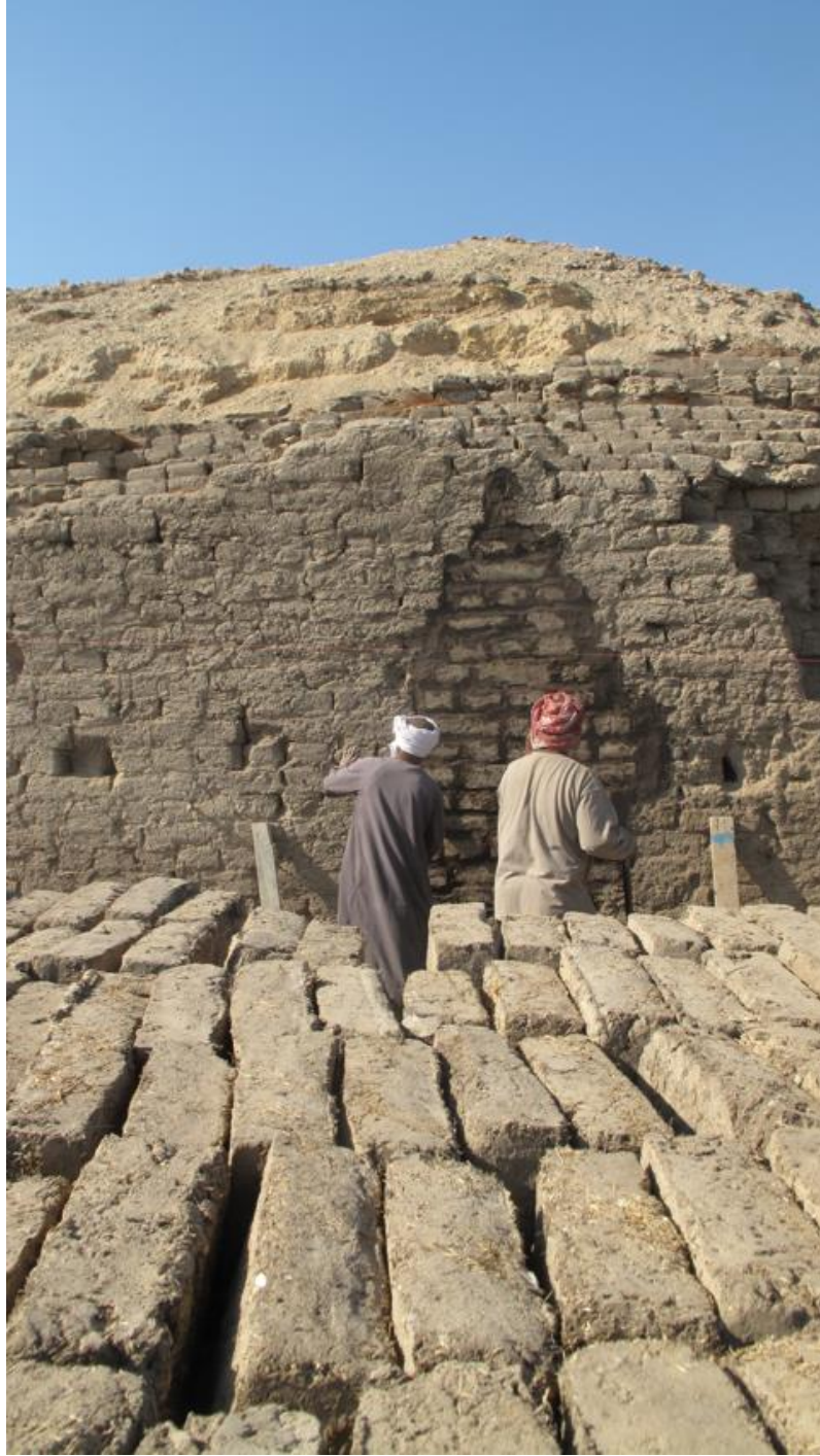
شكل ٣. واجهة "القصر الجنوبي" أثناء ملء الخسائر الناجمة عن اللصوص.