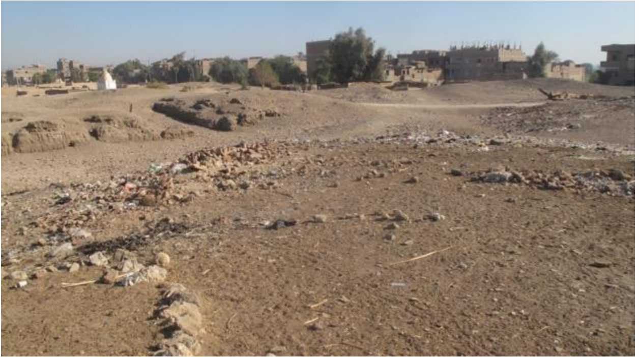
شكل ٦ : نفايات حديثة ملقاة بجانب القصر الشمالي.