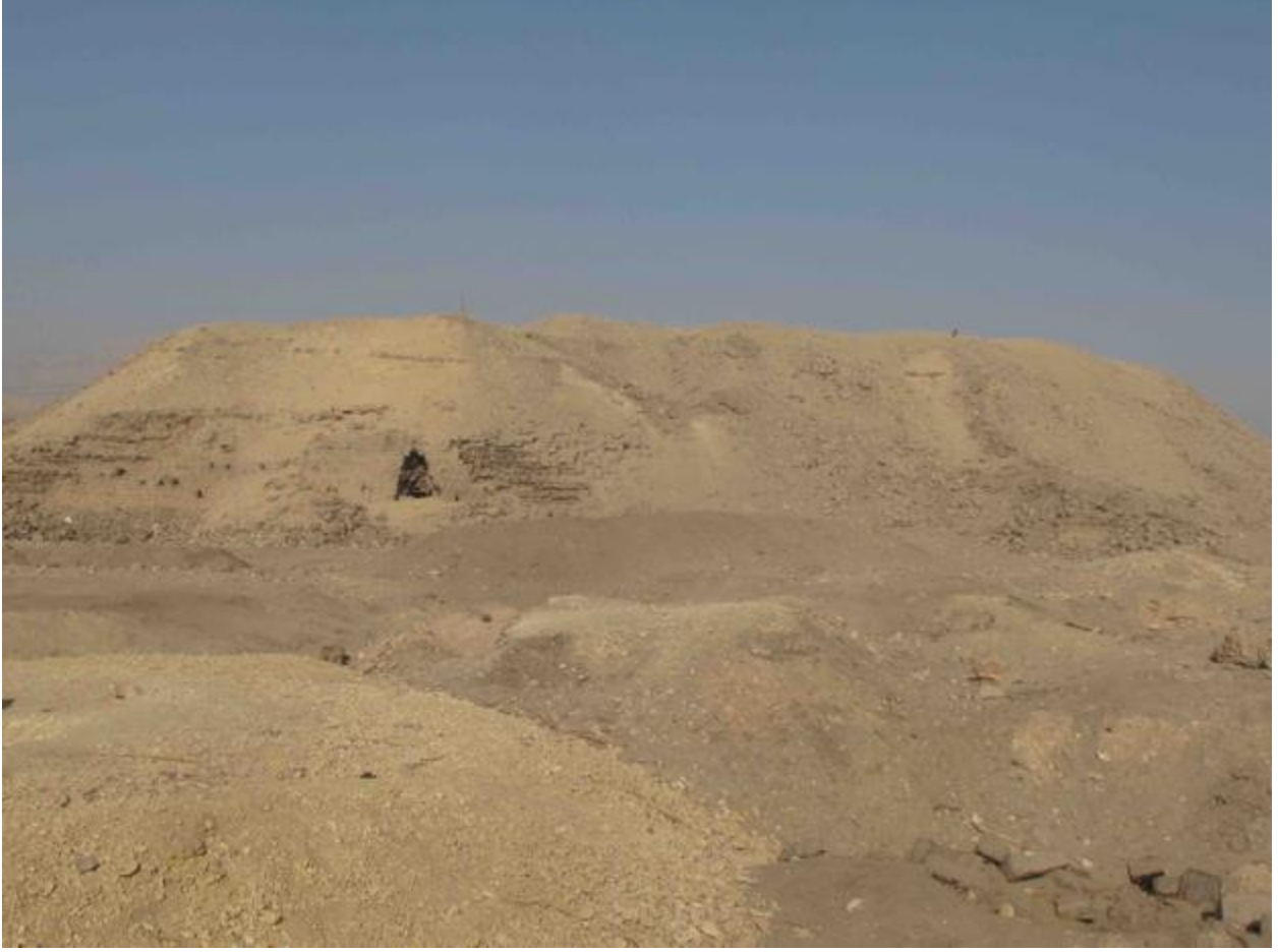
شكل ٢. واجهة "القصر الجنوبي" مع وجود ثقب تسبب فيه اللصوص في بداية العمل في عام 2018.