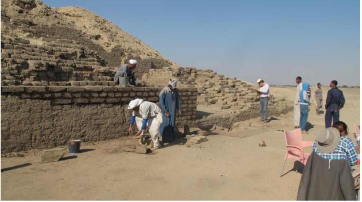
الشكل ٥ . تمت إضافة طبقة من شبكة الجيوتكسية بين المداميك الحديثة والقديمة في ترميم " القصر الجنوبي " .