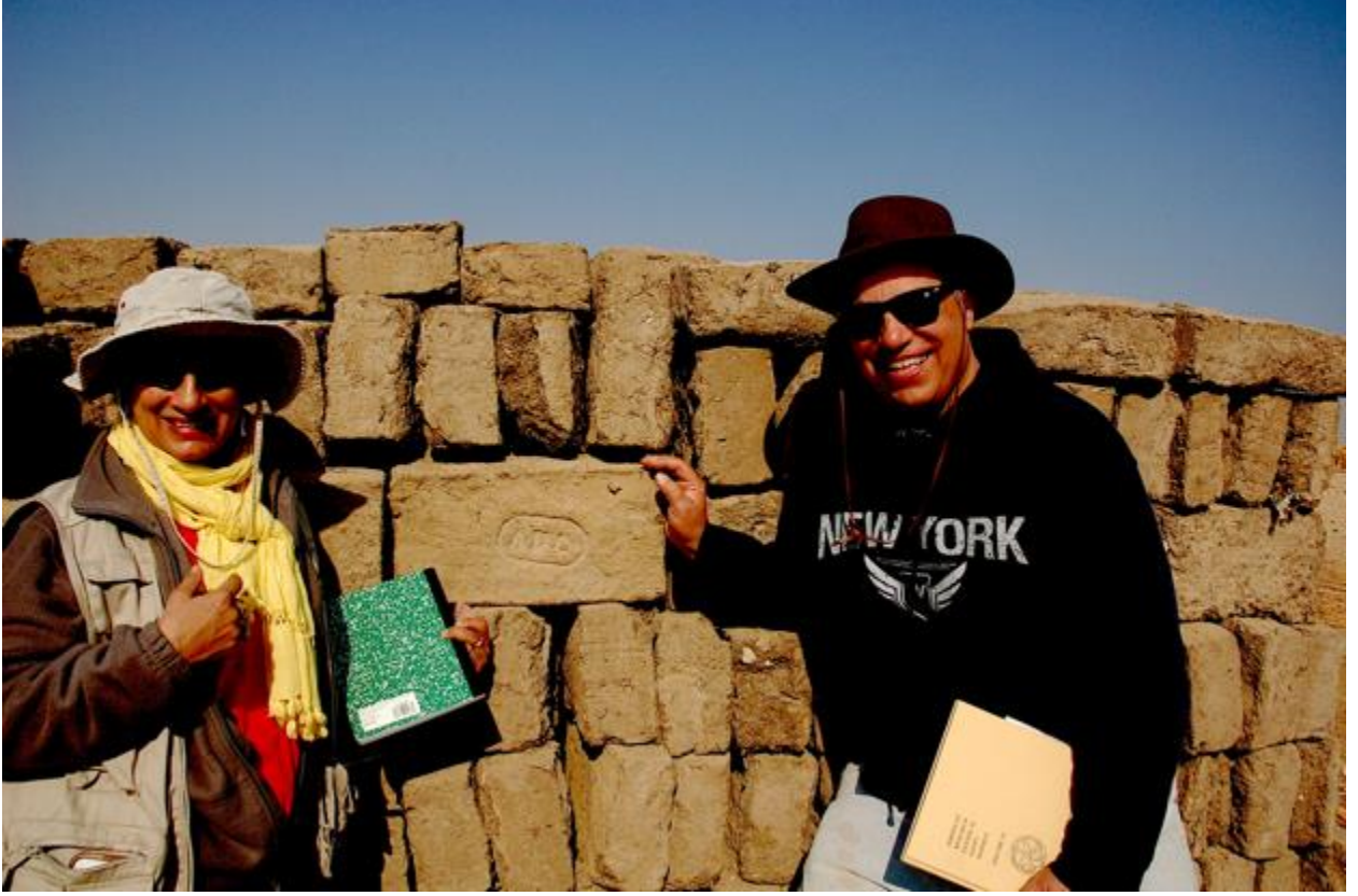
شكل ٤ : طوب طيني جديد مصنوع من أجل ترميم "القصر الجنوبي".